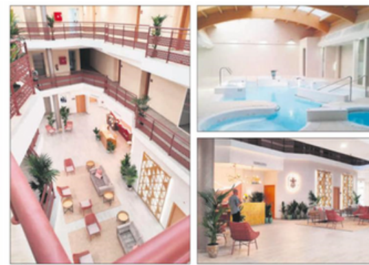
ESTRENO. Trabajadores del interior del balneario de Frailes, una espectacular zona para el confort de los jaenenses desde hoy.