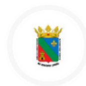
Excmo. Ayto. de Begijar