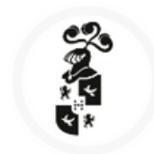
Excmo. Ayto. de Villanueva del Duque