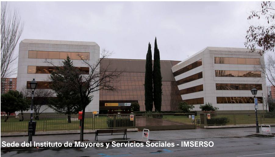
Sede del Instituto de Mayores y Servicios Sociales - IMSERSO

Autobuses: líneas 49, 67, 83, 124, 125, 127, 128, 132, 133, 134 y 137